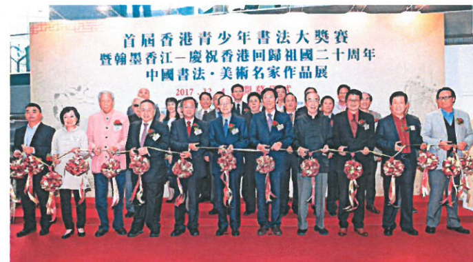
▲學生與書法名家展示作品 ▲章主禮嘉賓為展覽開幕剪綵

自古以來書法文化是我國文化藝術傳承的重要組成部分之一。從整理小篆的李斯，到號稱「書聖」的王羲之，再到有「宋四家」之譽的蘇軾、黃庭堅、米芾和蔡襄……歷朝歷代皆有書法名家輩出。時至今日，我輩華夏兒女又怎能不將此筆尖藝術繼續發揚光大？昨日下午於香港九龍塘創新中心舉行的「首屆香港青少年書法大獎賽暨翰墨香江——慶祝香港回歸祖國二十周年 中國書法·美術名家作品展」正是這樣一個傳承華夏藝術、弘揚文化瑰寶的活動。祖國之南，香江之畔，一群熱愛藝術肩負傳承民族文化重任的學生們在書畫藝術家的指導下提筆揮毫，書寫香港回歸祖國二十周年的美好與和諧。