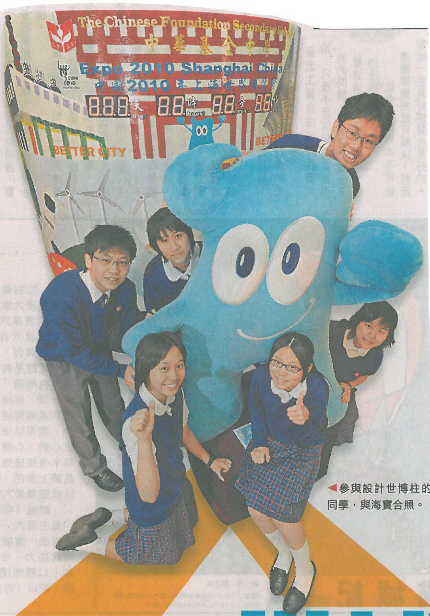
參與設計世博柱的同學，與海寶合照。

該校中二的全級 project，過去 10 年便研究過用海藻煉油、未來汽車等主題，亦曾進行有關物質和非物質的可持續發展課題，如研究涼茶、打小人等；學校更興建有太陽能板和有機農田，讓同學實踐可持續發展的概念。「未來 10 年，全球焦點是環保，年輕人要自小具有保育意識，未來不論他們從事哪種行業，也需要了解保育文化；最重要有一份心，這要自小培育；世博是個很好的機會，讓同學吸收新知，知道別人做了些甚麼，學習如何與人交流。」