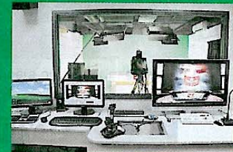
●校園電視台錄影室

「三三四」新學制將於下學年實行。新增的通識教育科是核心科目，韓老師表示，學校在04年讓有關老師受訓。而早於二千年，初中生要上增益課程，學習思考方法、專題研習、創意教育，為升高中作準備；06年，學校開設類似通識教育科的綜合人文科。同時，學校的媒體設備，提供了通識教育平台。校園電視台設有中文、英文、時事、體育等頻道。學生為頻道拍攝節目，可歸入「其他學習經歷」，一舉兩得。