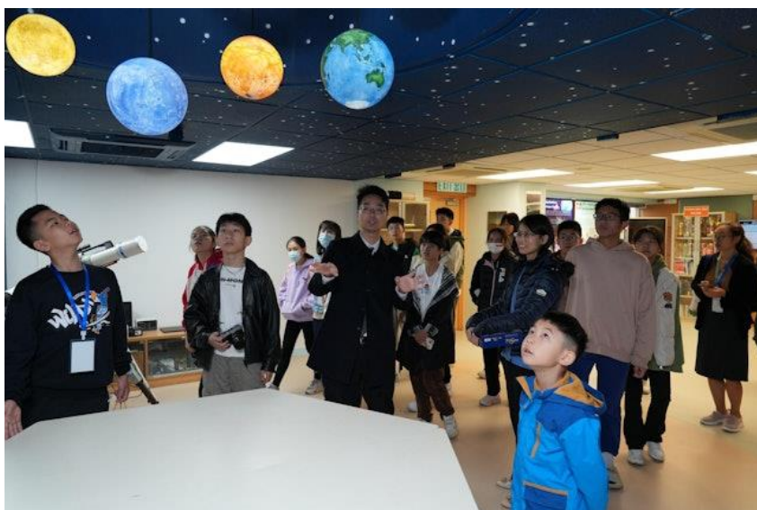
天台航天科技學習基地。

「立根中華文化，開拓國際視野，五育並重，發揮個人潛能」是中華基金中學自千禧年創辦以來一直所持守的。中基一直推行以學生為本的教學範式，定期修訂校本課程，更新學校設施，提供優質教育以讓師生適應瞬息萬變的世代，在教育發展上持續進步。