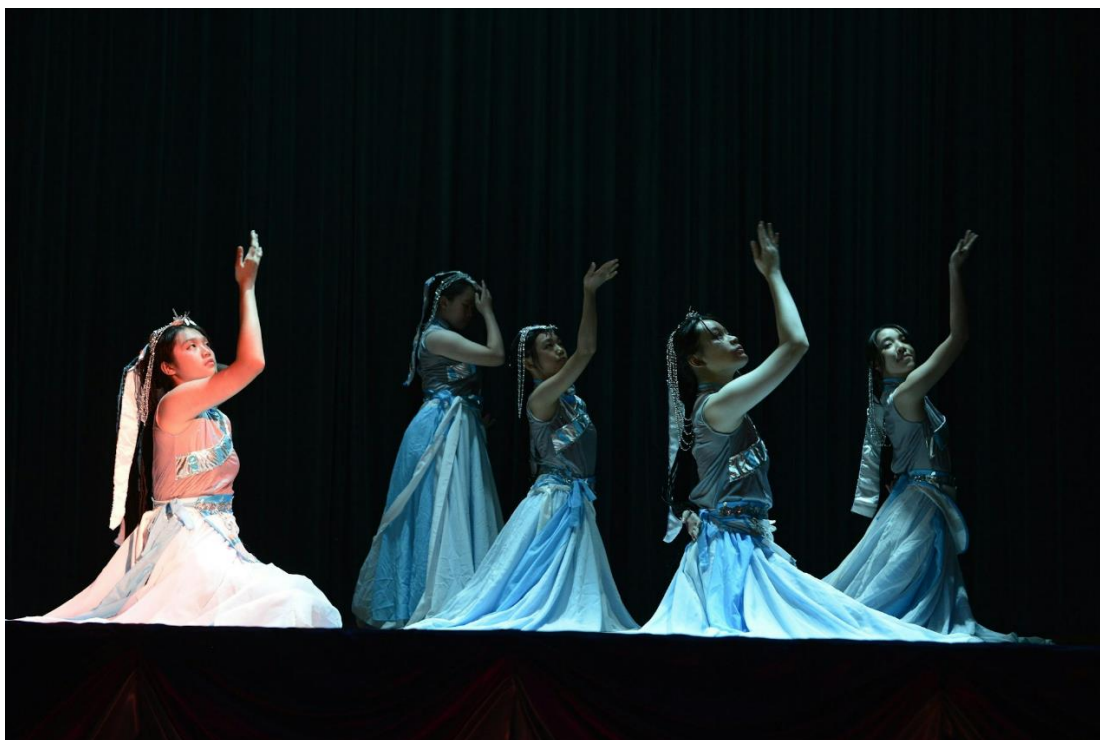
從表演藝術洞悉各國風土人情。

「工欲善其事，必先利其器」，學校充分利用校園各處作教學用途，讓同學擁抱學習機遇，包括將校園天台拓展成科學及可持續發展學習基地，並將多個特別室改建成研究中心，以進行航天科技、納米技術、生物技術、地質學、信息技術、人工智能等高端課題之研習及教育推廣，同時拓展體育、音樂、藝術及文化教育，結合校本課程以推動學生為本的學習活動，以培育人才，科教興國。輔導室打造成「智慧朋輩輔導員中心」，添置電子器材及體健遊戲，讓同學進行體感活動；智慧輔導室內設置交流區，同學統籌朋輩輔導員分享活動，加強團隊的凝聚力，而富中式設計的舒展區內設置軟坐墊等，同學進行靜觀、茗茶，欣賞中華文化之餘，靜聽心靈，達致身心靈健康。