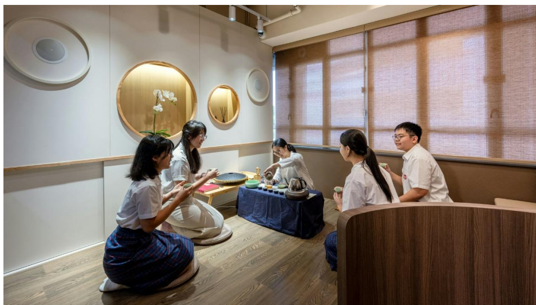
智慧朋輩輔導員中心。

校內的中華文化推廣活動、藝術教育與「全球意識計劃」一直環環相扣，讓同學多元發展，欣賞及尊重多元文化。在視覺藝術方面，傳統文化藝術與創新數碼藝術並重，學校設陶藝、中西書法、繪畫、攝影等興趣班，從視藝了解各地文化歷史。在表演藝術方面，除了傳統的中樂團、管弦樂團和合唱團外，學校對各民族的音樂及舞蹈等都加以推廣，從表演藝術洞悉各國風土人情。