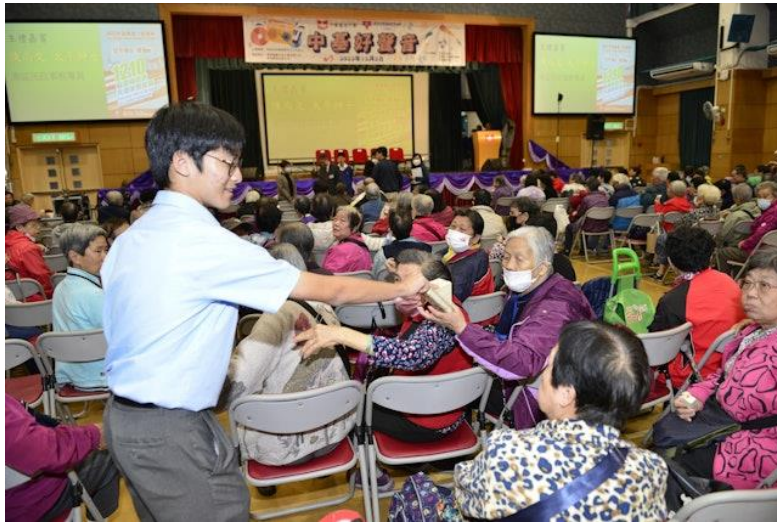
同學回饋社會，以愛還愛。

學校一直倡導全球意識，提升同學對全球時事的觸覺與洞察力，透過積極參與社區服務，希望同學回饋社會，以愛還愛，成為有遠見顯關愛的理想世界公民。學校每年都舉辦多次境外考察團，學生除學習不同國家民族的信仰文化、創新科技及可持續發展，更從中參與社區服務，傳頌關愛予不同地域。