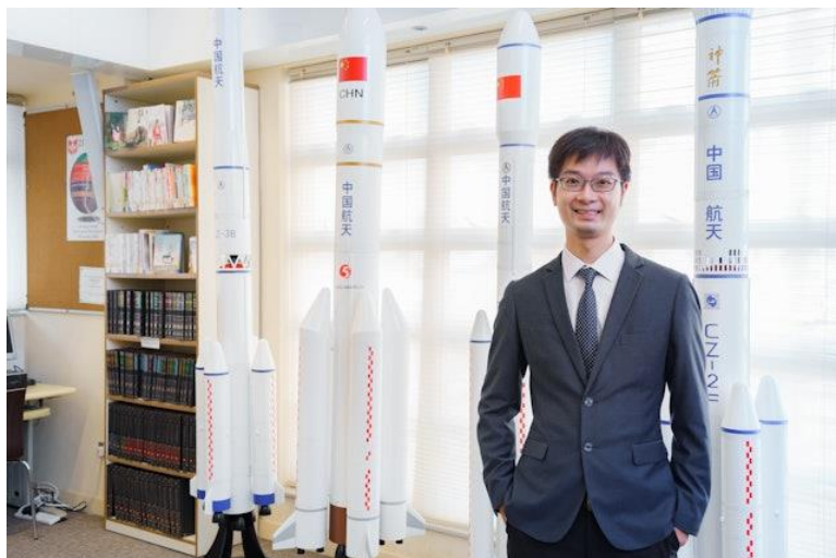
學校培育人才，科教興國。

感謝各位一直支持中基，植根學校，為這些幼苗給予陽光、空氣及溫暖，讓我們繼續同心同步同行，為下一代締造美好的將來。