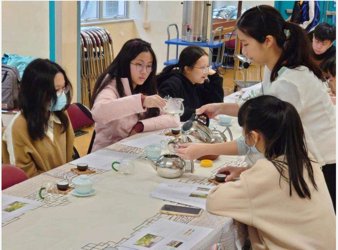
▲ 茶藝師教導資優生鑑別紅茶、綠茶和白茶等各種茶葉的專門方法。