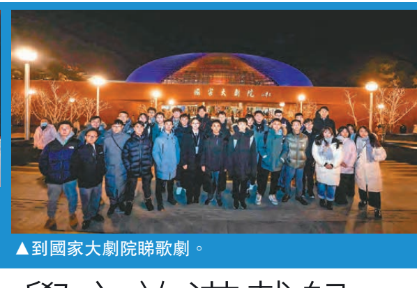
到國家大劇院睇歌劇。