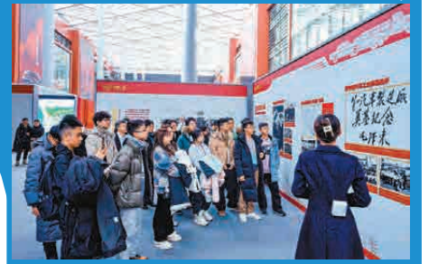
同學們到位於中朝邊界的吳大澂紀念地向這位「書生意氣」和「戎馬衛國」的愛國者表達崇高敬意！

讓我們跟隨這些香港中學生的文字，走進文化中國，走進「博覽華夏，逸筆未來」的文學之旅。