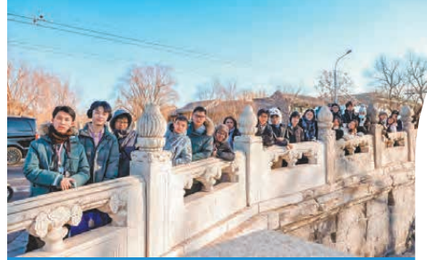
北京中軸線上的大運河上留影。