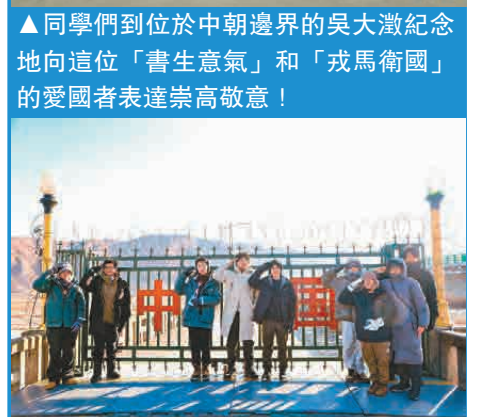
在圖門江中朝邊界參觀激發出男同學的保家衛國的熱情。