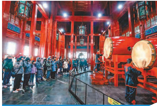
同學們登上鼓樓看表演。