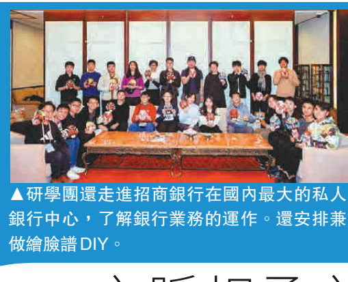
研學團還走進招商銀行在國內最大的私人銀行中心，了解銀行業務的運作。還安排兼做繪臉譜DIY。