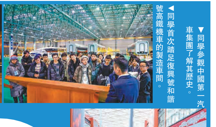
同學參觀中國第一汽車集團了解其歷史。同學首次踏足復興號和諧號高鐵機車的製造車間。